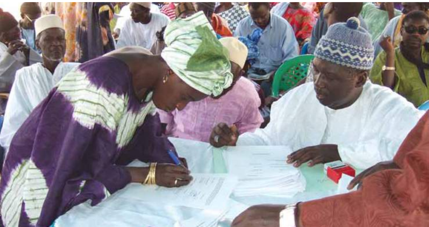
Signature de la lettre d'entente pour le remboursement des fonds de développement par les bénéficiaires dans le cadre du programme Les Savoirs des gens de la terre . ↓