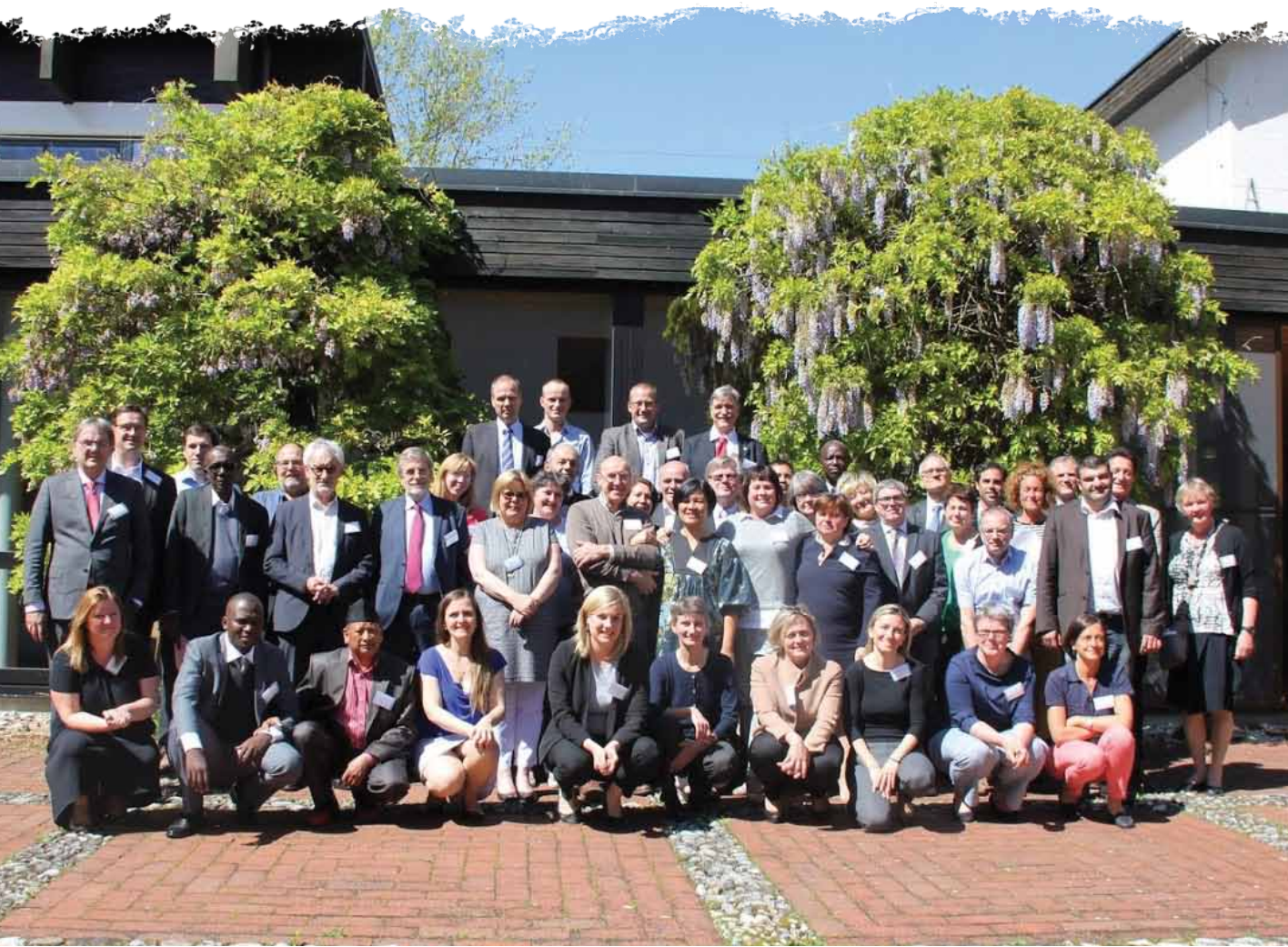
Membres d'AgriCord réunis en assemblée générale.