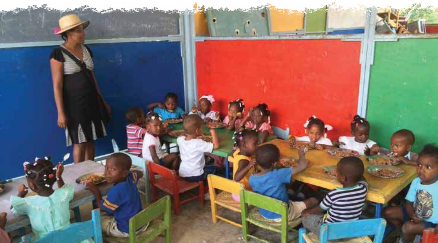
↑ Repas servis aux enfants de l'école de Labrousse bénéficiant de cantines scolaires.