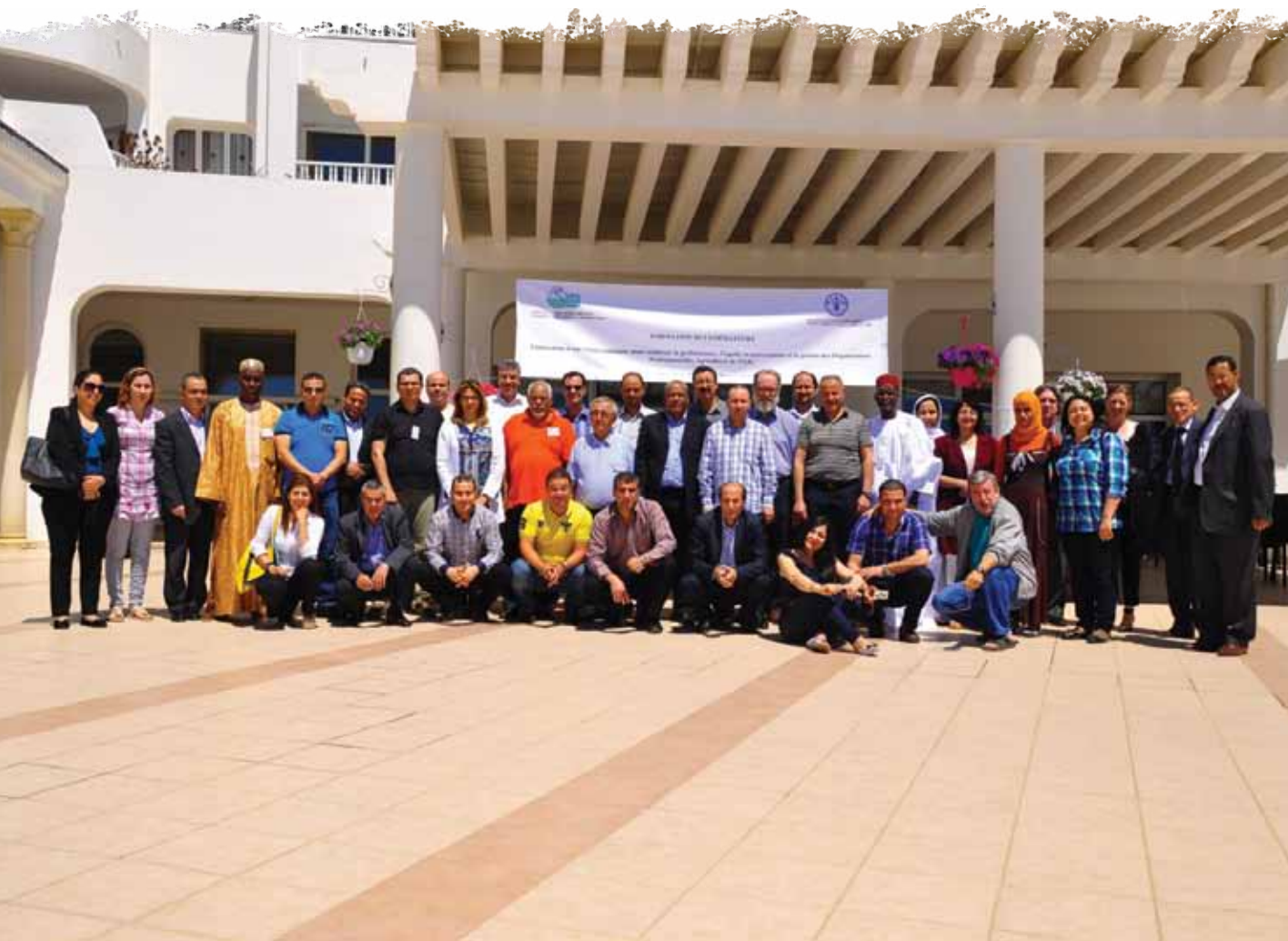
Formation de formateurs dans le cadre d'une démarche réalisée avec la FAO visant l'élaboration d'une vision commune pour le renforcer la performance, l'équité, la gouvernance et la gestion des organisations professionnelles agricoles et de la pêche au Maghreb.