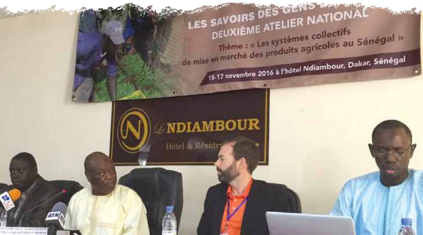
↑ Atelier national «Les systèmes collectifs de mise en marché des produits agricoles au Sénégal» dans le cadre du programme Les Savoirs des gens de la terre .