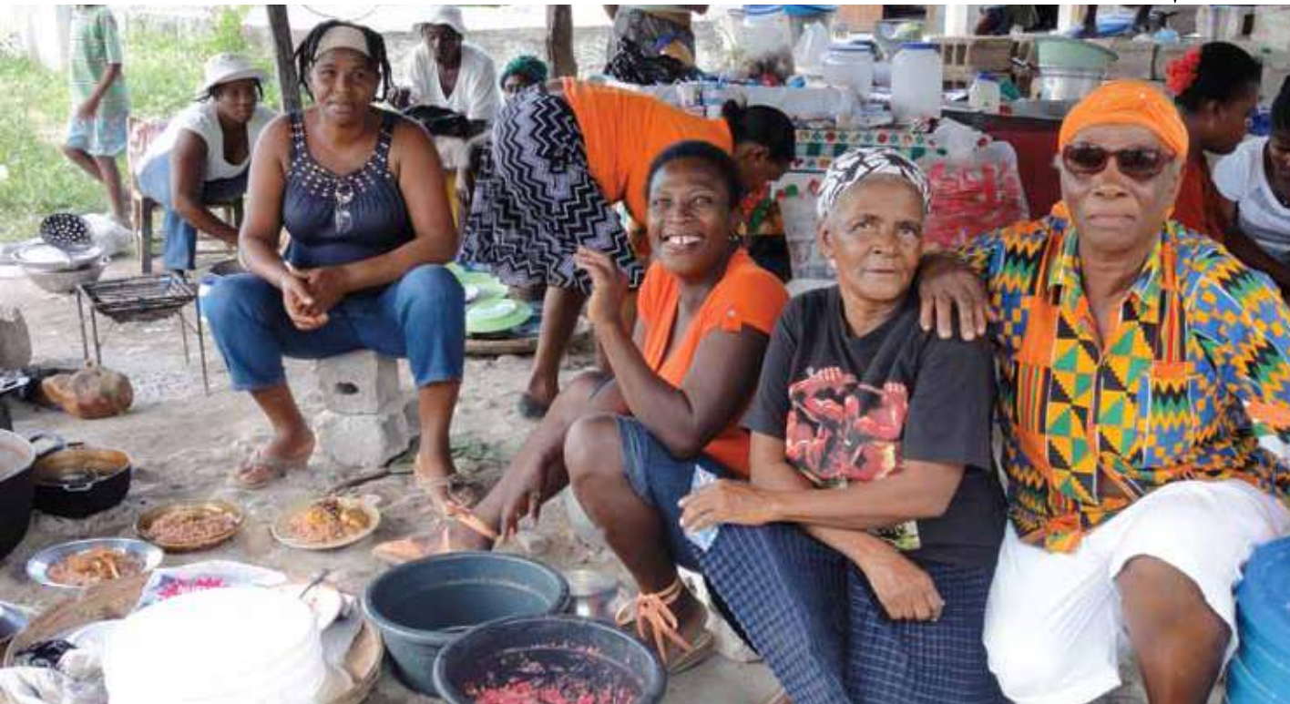
Préparation de repas par des femmes opérant une cuisine collective en Haïti. ↓